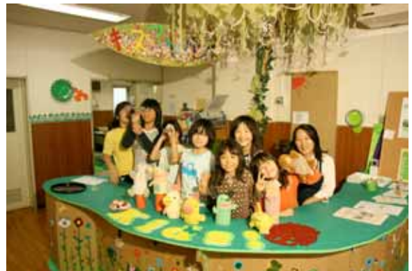
2008 活動より キッズアートハウス