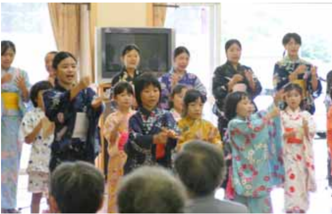
2006 活動より 茨城県常陸大宮市 特別養護老人ホーム「みわ」で交流