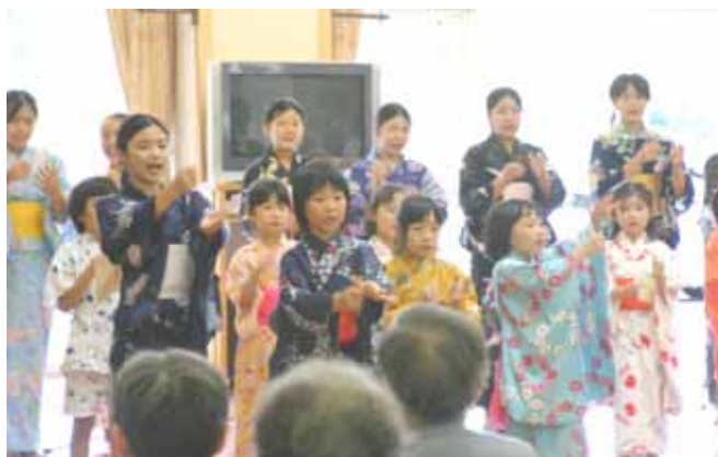
2006 活動より 茨城県常陸大宮市 特別養護老人ホーム「みわ」で交流

<出版物>楽譜:「子どもたちと創る地球ファンタジー海のふ・し・ぎ」「そらのふ・し・ぎ SONG BOOK」(音楽之友社)、CD「海のふ・し・ぎ」(ビクターエンタテインメント)、CD「そらのふ・し・ぎ」「見えない翼」(自主製作)