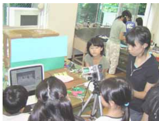
文部科学省委託事業 文化体験プログラム支援事業 「キッズミュージアム」でクレイアニメを制作